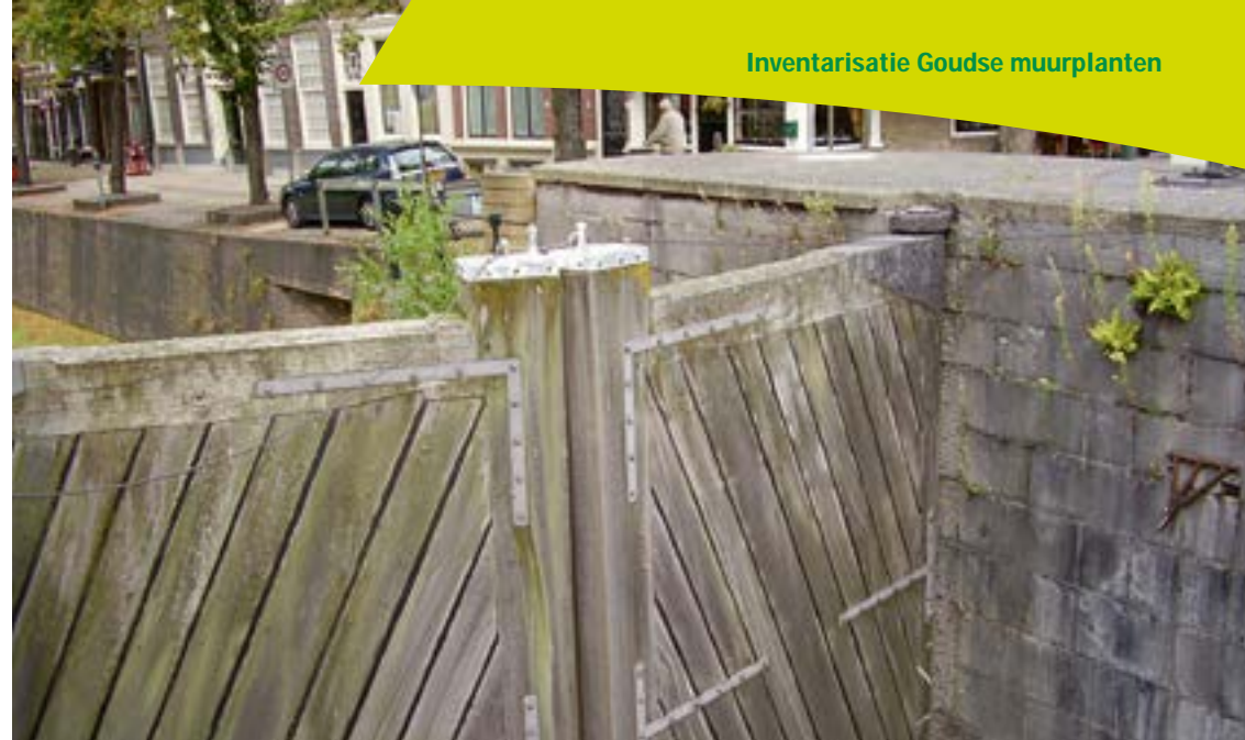
Varens bij de Visbank