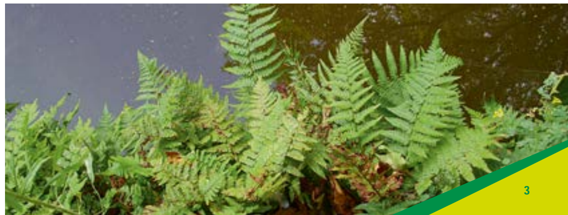
Varens bij de Visbank

Het is echter verheugend dat de zeldzame tongvaren zich op één plaats nieuw heeft gevestigd, zodat deze soort voor Gouda nog behouden is gebleven. De muurvaren is de enige soort die nog op diverse plaatsen vrij algemeen voorkomt. Aan de Zeugstraat werd het muurleeuwenbekje aangetroffen op een kademuur. Mannetjesvaren, smalle stekelvaren, wijfjesvaren en eikvaren komen in kleine aantallen voor op muren langs verscheidene grachten.