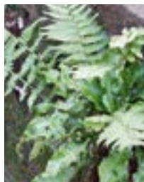
Tong- en Mannetjesvaren